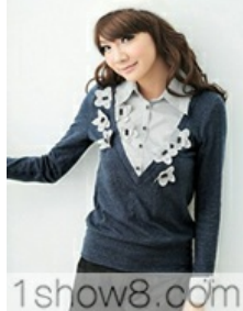
1show8.com Q-1690 OLj+0ĭG$öTd :÷247C 247 C 6ĭ | -p